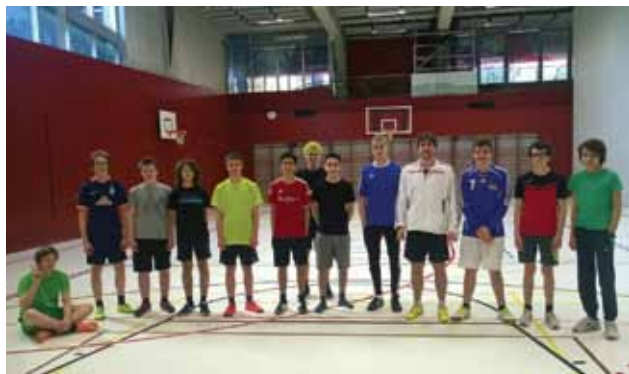
Z hodiny tělocviku na Realschule ve Vaduzu (Lichtenštejnsko)

V Norsku jsem měl školu přidělenou, ale na Tchaj-wanu jsem si ji musel sehnat sám. Stejně to funguje i na Islandu, takže jsem předtím obvolával různé školy a zjišťoval, kde by o mě měli zájem. Vyplnit veškeré žádosti a potřebné formuláře je hrozně náročný a dlouhý proces, vše musí být sepsáno v angličtině. Mimo popisu povinných tzv. horizontálních témat musíte v žádosti uvést i předchozí projekty. Při hodnocení žádosti jsou pak přidělovány body i za jazykové kompetence. Žadatel pak musí hodnotitele přesvědčit i tím, jak je motivován, jaké má zkušenosti, co chce v rámci projektu udělat. Žádosti hodnotí externí hodnotitelé, kteří nejsou z ČR, a pak už záleží jen na jejich hodnocení, zda žadatel obdrží či neobdrží stipendium.