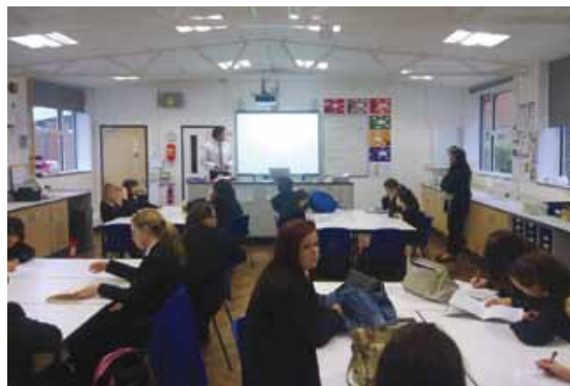
Výuka na Newton Abbot College v Anglii

Třeba v Norsku jsem vyučování v jejich mateřštině zvládal po pěti měsících. S islandštinou na tom tak dobře nejsem, tam jsem byl jen tři měsíce, tam třeba jsem dokázal vést hodinu tělocviku, ale ostatní hodiny ještě ne. Ale důležité je, že se člověk domluví. Ale koneckonců se člověk všude domluví anglicky, a to i v německy mluvících zemích, kde se říkalo, že na tom nejsou s angličtinou dobře, protože ji nemají rádi. V Lichtenštejnsku učím šestou třídu a mluvím na ně anglicky, protože gymnázium to tak vyžaduje, a pro děti zde to není vůbec žádný problém.