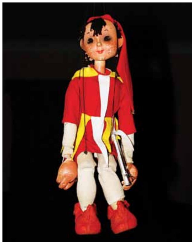
Tři podoby smiřického Kašpárka

V roce 1948 sehrána 4 představení: 2x Janek v pekle, Mikulášská nadílka a Koblížek na cestách. Po únorových událostech povolána vláda Obrozené Národní fronty, odhodlaně nastoupena cesta k socialismu, v jednotách ustaveny akční výbory. Vyhlášena nutnost jednotné tělovýchovy, tentokrát direktivně vládním nařízením. Loutkáři měli krušné podmínky ve školní tělocvičně, kde stále více času zabíral biograf. Hrát bylo možné 1x za měsíc, v neděli odpoledne, na zkoušky nezbývalo místa ani času. Jevíště a rekvizity bylo nutné rychle rozebrat a uklidit, aby v 17 hodin mohl začít biograf. Když se pak naskytla možnost získat