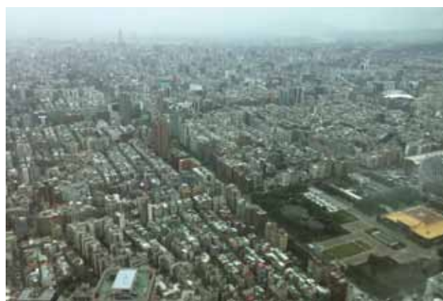
Pohled na Taipei z mrakodrapu Taipei 101 (výška 509 m)

Po šesti měsících studia čínského jazyka na univerzitě v Taipei jsem se vrátil do Česka, tady jsem si jen vyměnil věci za zimní a tři dny na to jsem už byl v malé vesničce s 900 obyvateli na druhém konci světa na Islandu. A to byl šok – jeden den teploty přes 40 stupňů, za pár dní kolem 7 stupňů, takže je člověk hned nemocný. Ale zato ta krásná čistá příroda, čistý vzduch... Říká se, že trvá asi 90 dní, než si člověk zvykne na nové podmínky. U mě to už je trochu rychlejší, vzhledem k tomu, že už jsem vystřídal více zemí. A pak mě mrzí, že když už si tam člověk zvykne, že je jednou konec.