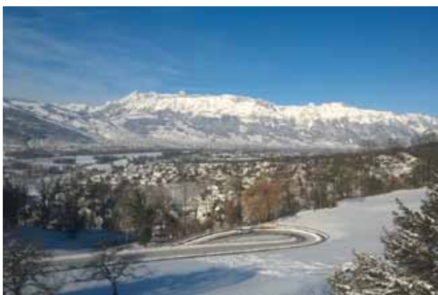
Vaduz – Lichtenštejnsko

Ano, vždy, za poslední tři roky se základy češtiny naučilo asi 200 dětí. Dříve bych řekl, že je čeština baví. Mám jednu studentku z Anglie, která