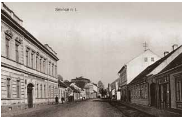
Hotel Andrejsek (vlevo), kde loutkové divadlo sídlilo

Mimo Sokola zde působily další ochotnické spolky jako Jednota divadelních ochotníků Jirásek a pěvecký spolek Hanka. V roce 1921 zahájil svoji činnost sokolský biograf němým filmem Černí myslivci za doprovodu hudebního kroužku, poté byl za hojně účasti předveden film Krásná zebračka. Investice do zařízení biografu ve Dvoraně činila 50.000 Kč. Roku 1923 byl biograf přemístěn do sálu hotelu Andrejsek, což si vyžádalo nové zařízení, sklápěcí sedadla, piano pro orchestr za 10.000 Kč a nová osvětlovací tělesa. Ukázalo se však, že výnos biografu neodpovídá očekávaní návratnosti investice. Zvuková aparatura pro biograf byla zakoupena v roce 1931. První promítání zvukového filmu ve Smiřicích se uskutečnilo 12. prosince 1931, promítán byl film Fidlovačka.