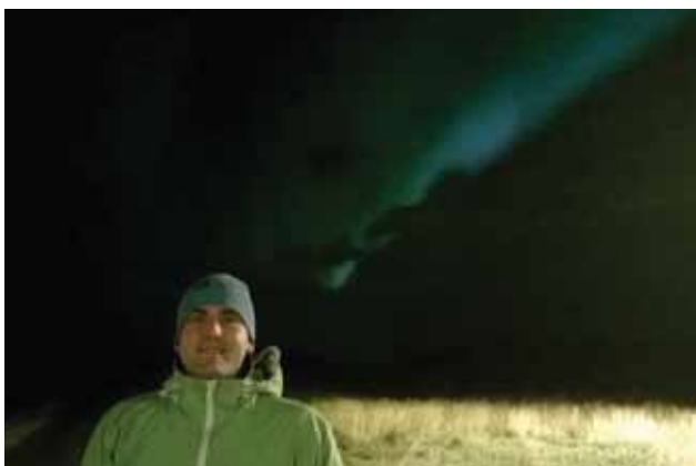
Polární záře nad městečkem Grundarfjörður na Islandu

Neuvažujete, že s cestováním skončíte, že se tady usadíte a – jak se říká – jako správný muž postavíte dům, zasadíte strom a zplodíte syna?